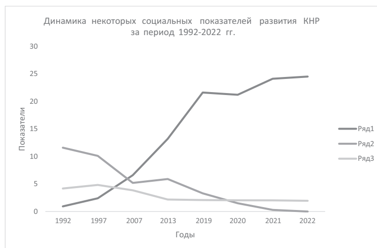
Рис. 1. Динамика социальных показателей развития Китая за 1992–2022 гг.