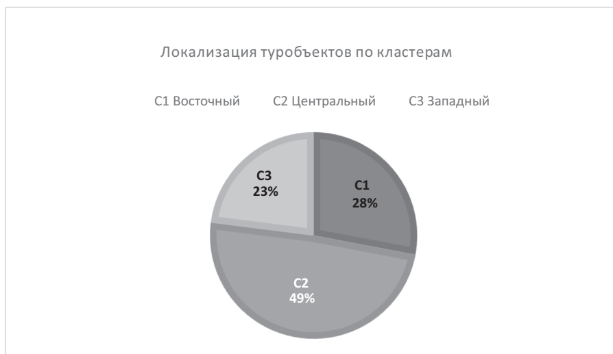
Рис. 2. Структура локализации туристических объектов Китая категории 5А по кластерам (%)

Локализация туристических объектов категории 5А по ранее выделенным кластерам (рис. 2) имеет следующую структуру: С1 «Восточный» — 28%; С2 «Центральный» — 49%; С3 «Западный» — 23%; наибольшее число туристических объектов категории 5А находится в «Центральном кластере» (С2) — 110, но наибольшая их плотность (22 объекта) фиксируется в провинции Цзянсу, относящейся к «Восточному кластеру» (С1).