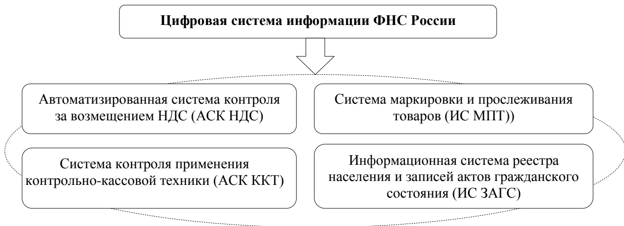
Рис. 1. Основные элементы цифровой системы информации ФНС России 1

В рамках дальнейшего развития электронных сервисов ФНС России с 2019 года поэтапно внедрило и активно использует в своей деятельности собственную разработку – АИС «Налог-3». Данный комплексный программный продукт является объединенной автоматизированной информационной системой, которая позволяет значительно повысить уровень автоматизации функционала деятельности Федеральной налоговой службы России в рамках своих компетенций, определенных соответствующим Положением О ФНС России, а также дает возможность в бесконтактном режиме осуществлять прием, обработку, предоставление данных и анализ информации, формирование информационных ресурсов налоговых органов, статистических данных, сведений, необходимых для обеспечения поддержки принятия управленческих решений в сфере полномочий ФНС России и предоставления информации внешним потребителям 2 .