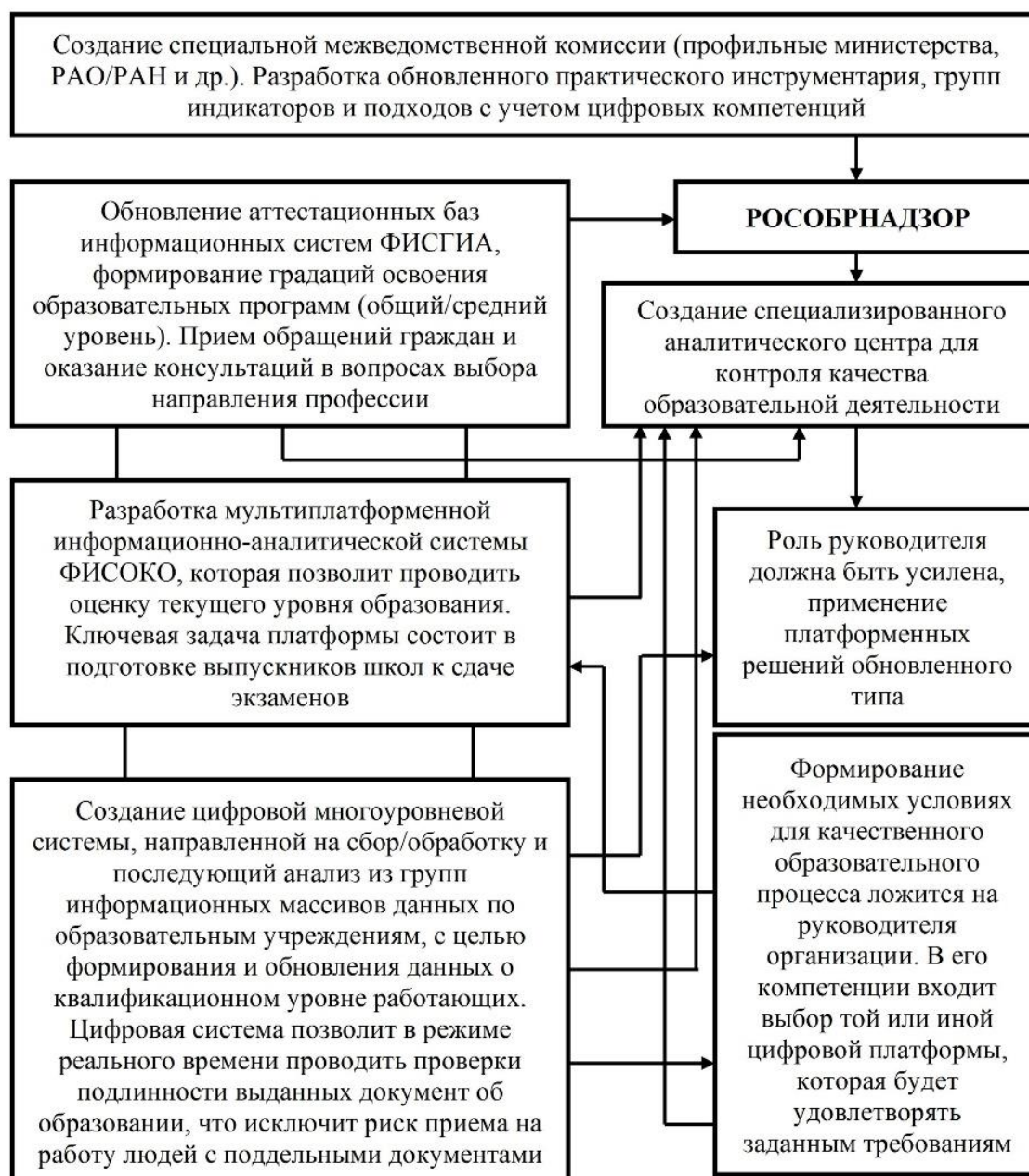
Рис. 2. Обновленный вариант модели организации многоуровневой системы контроля в образовательной сфере на основе синтеза цифровых решений