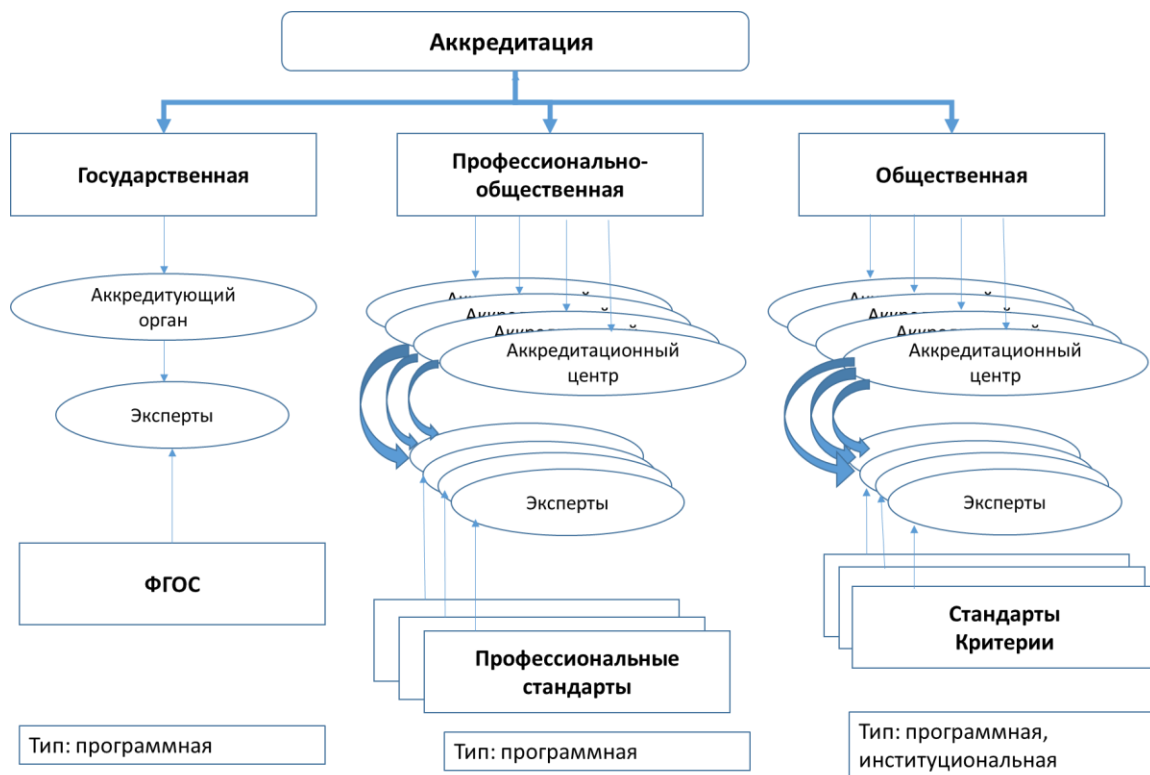
Рисунок 5 – Типы аккредитации

Следовательно, вопросы формирования системы аккредитации, регламентации и организации взаимодействия различных видов аккредитации отнесены на уровень подзаконных актов, при этом требуется выбрать вариант реализации общей системы аккредитации, модель взаимодействия подсистем и механизмы реализации выбранной модели.