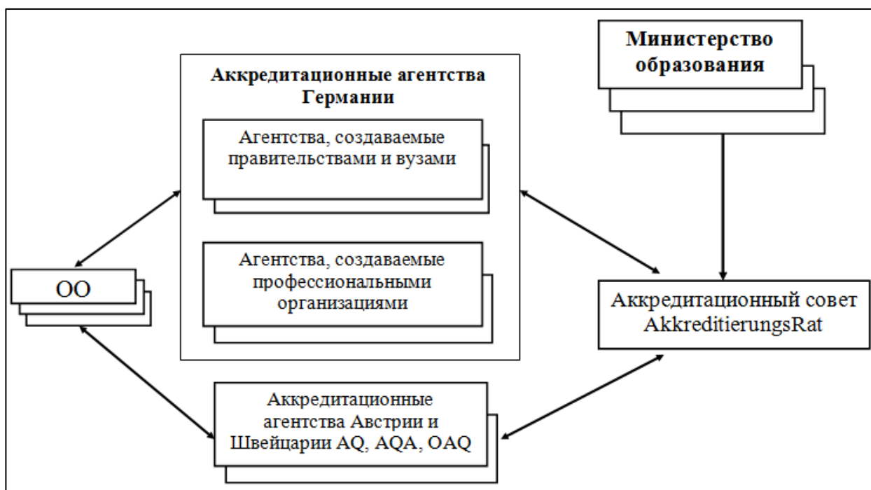
Рисунок 3 – Система аккредитации в Германии

В соответствии с решением Постоянной конференции министров образования и культуры федеральных земель ФРГ и Ассоциации университетов и других вузов Германии система аккредитации изначально строилась как распределенная структура с единым координирующим центром: процедура аккредитации разрабатывается Аккредитационным советом, а осуществляется отдельными агентствами.