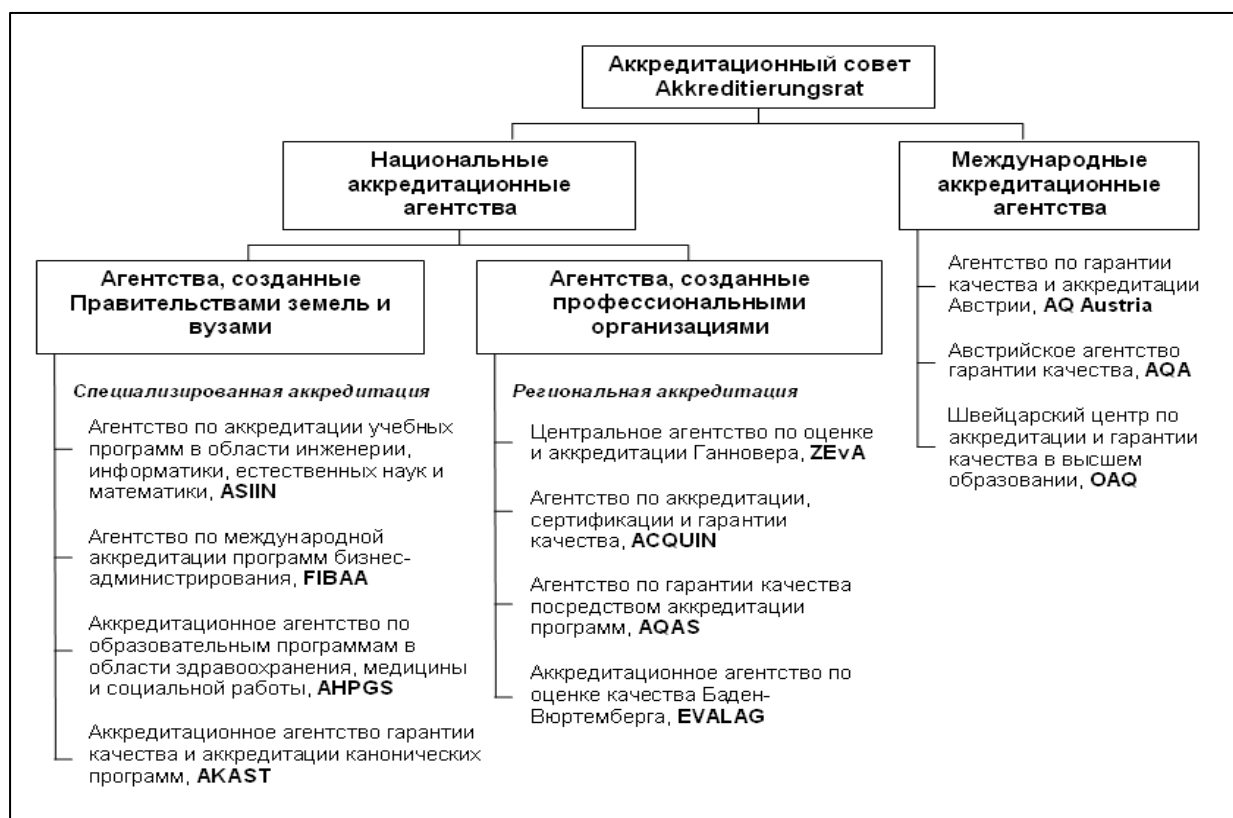
Рисунок 4 – Взаимодействие аккредитационных агентств Германии

Региональные аккредитационные агентства поддерживаются правительствами или вузами одной или нескольких федеральных земель Германии и отвечают за весь спектр учебных программ. Однако, несмотря на наличие региональных агентств, не существует их «регионального монополизма»: сфера деятельности агентства не ограничивается регионом, учебные заведения и правительство которого являются его учредителями. Заявление на аккредитацию высшего учебного заведения может быть подано в любое аккредитационное агентство Германии.