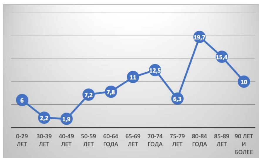
Рис. 2. Прирост нуждающихся в уходе

Рисунок 2 наглядно иллюстрирует, что с увеличением возраста идет постепенный прирост нуждающихся в уходе, причём резкий скачок происходит достаточно рано – в районе 50 лет (по-видимому, уже в этом возрасте значительная часть людей сталкивается с проблемой потери здоровья и трудоспособности). Интересен и тот факт, что на отрезке 75-79 лет наблюдается резкое снижение количества людей, требующих ухода. На данном этапе дать однозначную интерпретацию данному феномену сложно: не исключено, что мы имеем дело со смещением выборки. Однако может подтвердиться и другая гипотеза, согласно которой люди, достигшие 75-летнего возраста, обладают, в целом, сохранным здоровьем и способны оставаться самостоя-