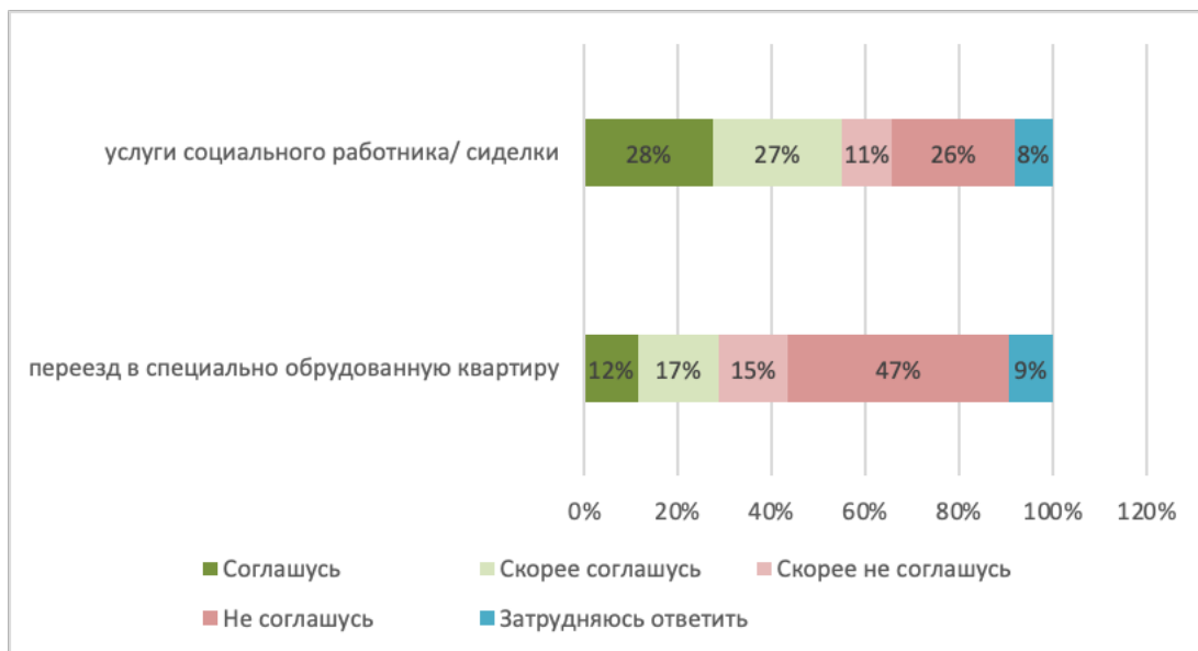
Рис. 1. Востребованность в будущем услуг социального работника и переезда в специально оборудованную квартиру

по итогам ответа на предыдущий вопрос. Возможность переезда в специализированную квартиру рассматривает в данном случае почти 30% опрошенных, вариант с сиделкой является приемлемым для 55% опрошенных (рис. 1).