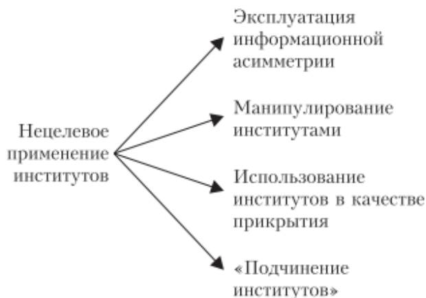
Рисунок 3. Схема нецелевого использования институтов.

Вместе с тем следует оговорить, что в рамках стратегического планирования и достижения долгосрочных целей развития важным оказывается не только создание соответствующих институтов, но еще и защита таких институтов от нецелевого использования. Например, Л.Полищук [17] выделял как минимум 4 вида нецелевого использования институтов ( рисунок 3 ).