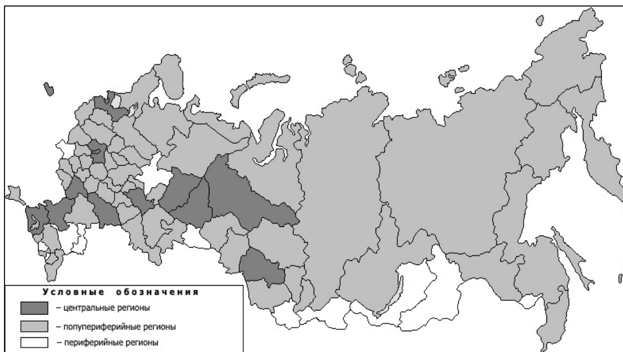
Рис. 3. Схема российской модели «центр – периферия» Составлено авторами