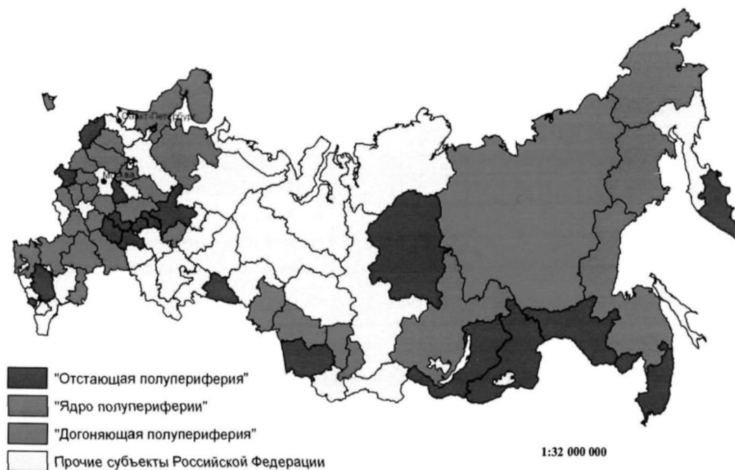
Рис. 2. Распределение полупериферийных регионов по уровню социально-экономического развития. Составлено авторами

Однако отнесение региона к полупериферии достаточно условно, поскольку, если рассматривать его внутреннюю структуру, то в нем существуют депрессивные районы, которые лишены развитой инфраструктуры, обладают денудированной промышленностью либо архаичным сельским хозяйством, а их поселенческая структура постепенно разрушается из-за депопуляции. Поэтому регионы группы, например, «отстающей полупериферии», справедливо относить и к периферии по совокупности характеристик социально-экономического развития большинства районов.